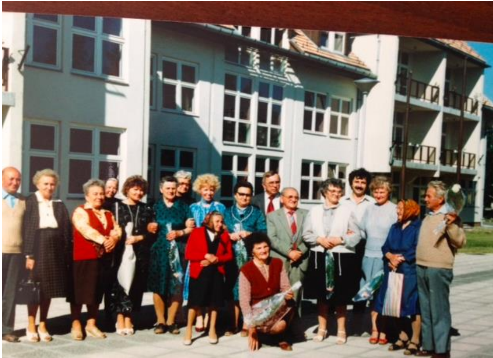
1. sz. melléklet: A nyugdíjasok középiskolájának első évfolyama – a tanévzáró ünnepség után a gimnázium épülete előtt