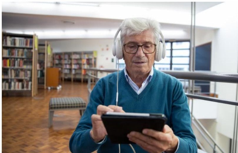
1. kép: Tabletet használó észt nyugdíjas

A programban bemutatkozott a valladolidi városi könyvtár is, mely a pandémia ideje alatt is jelentős digitális támogatást nyújtott a helyi közösségeknek. A digitális könyvtári óráik ingyenesek, előregisztrációhoz kötöttek, meg lehet őket nézni és hallgatni online felületen is rögzített formában. Számítógépes és okostelefonos alapozó képzéseik alapszinttől indulnak, minden héten azonos oktatóval. Itt a képen egy 80 esztendősi diák látható, aki korábban tartott a tablethasználattól, de ma már minden nap segíti őt.