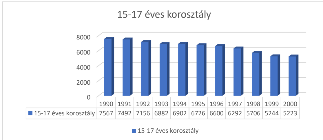
2. ábra: Hátrányos helyzetűek a középiskolákban (15-17 éves korosztály) 1990-2000

A diagramból megállapítható, hogy a hátrányos helyzetű tanulók száma az évek múlásával folyamatos csökkenést mutat. Általánosságban elmondható, hogy a szakiskolákban a gimnáziumhoz képest a hátrányos helyzetű és a halmozottan hátrányos helyzetű diákok aránya magasabb.