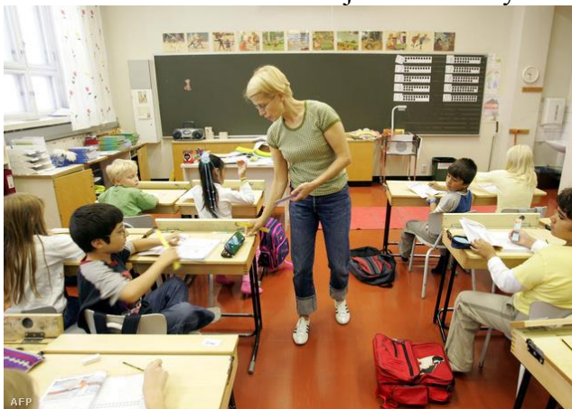
7. ábra Életkép egy finn iskolából

A finnek kiváló PISA eredményei mögött tudatosan és sikeresen felépített oktatási modellről van szó, amelyben minden szereplő a tudása legjavát nyújtja. 14 A kötelező kilencévi iskolaeltartás ideje alatt Finnországban alig több az iskolaelhagyók aránya, mint 1 százalék, ami messze a legjobb arány a világon, de az iskolaelhagyóknak több mint a fele később a felnőtt oktatás keretében befejezi tanulmányait.