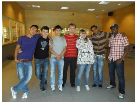
6. ábra Egy sokszínű svéd iskola