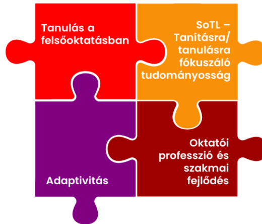
2.ábra: A minőségi tanulást célzó négy kiemelt kutatási terület

ésszerűen megválogatott köre. Míg a négy fő fogalom képezi a tanulmány gerincét, a kapcsolódó témákról egyértelműen, de mértékkel szólunk, a fókusz megtartása érdekében.