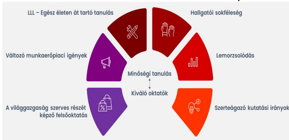
1.ábra: A felsőoktatást érintő kihívások és követelmények